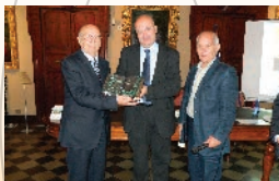
Bompiani Editore 2013