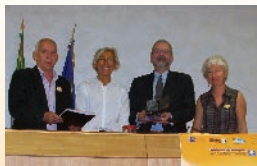
Einaudi Editore 2012