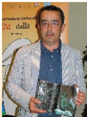
Adelphi Editore 2014